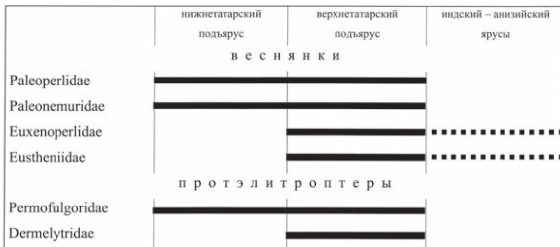
Рис. 2. Стратиграфическое распределение семейств веснянок и протэлитроптер с татарского по анизийский века.

Интересно отметить, что поведение других веснянкообразных в рассматриваемый период времени было довольно сходным. Там были представлены два отряда потомков гриллоблаттид – веснянки и предки ухверток протэлитроптеры. Детальные данные по их распределению по местонахождениям здесь не приводятся (это составляет предмет отдельного исследования), и стратиграфическое распро-