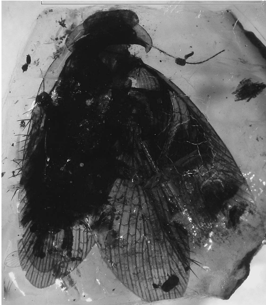
Рис. 2. Общий вид самки Ocelloblattula ponomarenkoi gen. et sp. nov. из раннемелового ливанского янтаря. Длина масштабной линейки соответствует 5 мм.

со слабозатемненным анальным полем и тремя характерными темными пятнами, а задние крылья со слабозатемненной областью птеростигмы), а также слабозатемненными голенями, лапками и церками. Покровы гладкие, блестящие, с пунктировкой лишь в анальном поле надкрылий и коротким опушением на антеннах, щупиках и по заднему краю стернитов брюшка; генитальная пластинка и церки с редкими и длинными волосками.